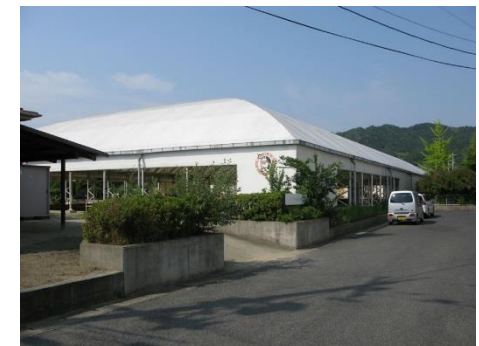
ゲンキかさおか広場

主に、会議や話し合い等に使用する部屋です。広さがあるので教室としても利用可能です。ミーティングルームよりも機密・秘匿性に優れます。